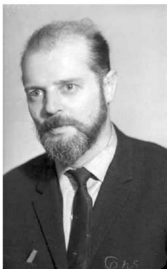
Александр Сергеевич Есенин-Вольпин, 1924-2016

В 1919 году в литературном кафе Есенин знакомится с поэтессой и переводчицей Надеждой Вольпин. Провожая её домой, он дарит ей книгу своих стихов с надписью «Надежде с надеждой». Их пути пересекутся ещё не раз, а пока Есенин встречался с Галиной Бениславской, влюбляется в известную танцовщицу Айседору Дункан и сразу же делает ей предложение. Вместе с ней отправляется в Европу и Америку. Но это трудно назвать счастливым свадебным путешествием. Дункан много пьёт, начинаются