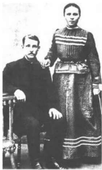
Родители Сергея Есенина: Александр Никитич и Татьяна Фёдоровна

Безудержная тяга к свободе досталась Сергею от мамы.